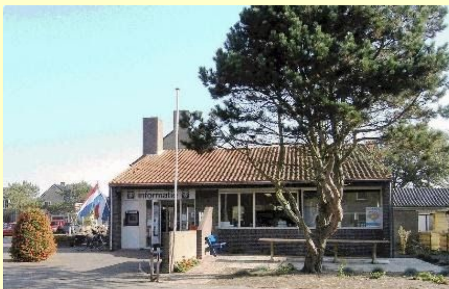
Afb. 13 Huidig DOP-gebouw wordt gezien het toenemend bezoek te klein