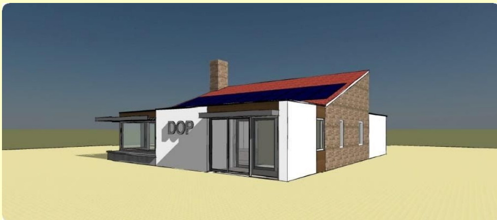
Afb.: 16. Perspectief geplande uitbouw van het DOP-gebouw

We hebben de uitkomst van dit overleg via een Nieuwsbrief aan onze vrijwilligers bekend gemaakt. De daaropvolgende bijeenkomsten zijn onze bezoekers hierover ook geïnformeerd.