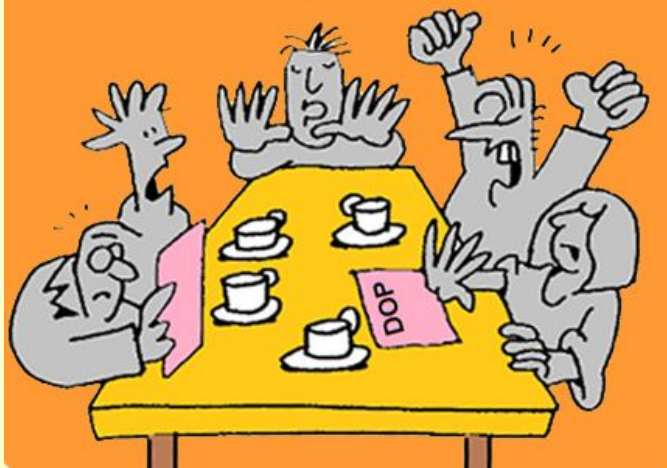
Afb.:15. 8 juli 2019 reageerden bestuursleden Stichting Exploitatie en Beheer Accommodaties Petten (SEBAP) op het verbouwplan DOP-gebouw. SEBAP verhuurt namens de gemeente het DOP-gebouw

Ook moeten we de "lelijke" tafels uit de voortuin worden verwijderd. De gemeente heeft ons op het eind van dit overleg verzocht gezamenlijk vervolgoverleg te voeren om te trachten een oplossing te vinden.