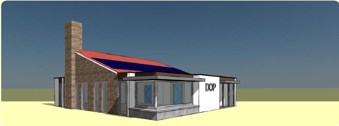
Afb.14. Perspectieftekening nieuwbouw DOP-gebouw

Maart 2019 hebben we overeenstemming bereikt over het te kiezen ontwerp voor deze uitbreiding. De architect heeft een kostenraming opgesteld en wij een begroting voor de benodigde inventariskosten. Totaal benodigde krediet bedraagt € 350.000, -.