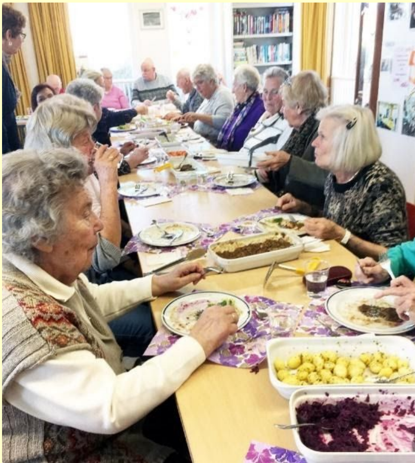
Afb. 17: Op 27 februari was het DOP vol bezet met 21 bezoekers tijdens de maaltijd van Tafeltje Dekje