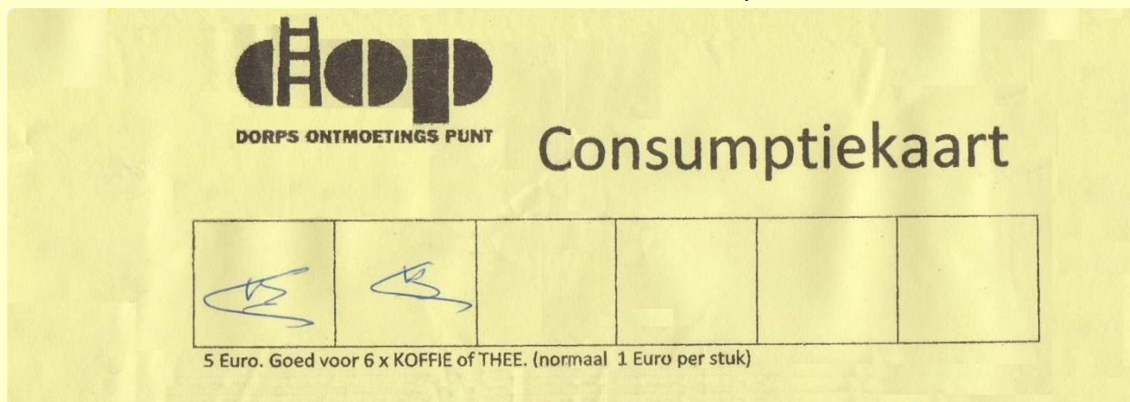
Afb. 21. Consumptiekaart DOP, goed voor zes consumpties

De toename van het aantal bezoekers beïnvloedt het kassaldo positief.