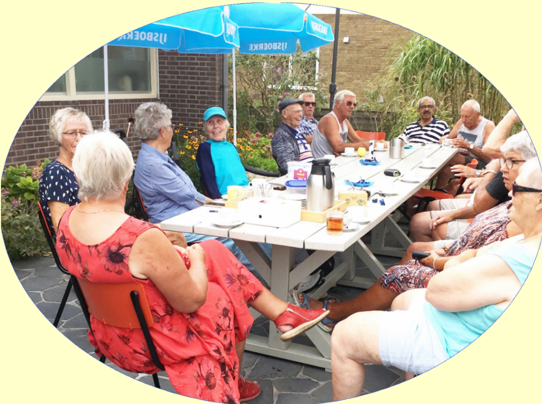
Afb. 1. In de zomer van 2019 was het meermalen mogelijk om met veel plezier van het buitenterras gebruik te maken, zoals hier op 28 augustus 2019

Het bestuur heeft dit jaar veel tijd besteed aan onderzoek om het bestaande DOP-gebouw uit te breiden. Dit omdat we bij onze regulaire bijeenkomsten soms al aan de limiet van onze opvangmogelijkheden raakt en omdat we voor het steeds groter aantal bezoekers uitbreiding van activiteiten willen organiseren. Zie hiervoor hoofdstuk 8.