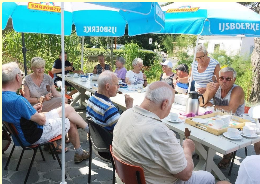
Afb. 22. Op 24 juli trakteerde de Spar Petten alle bezoekers ter afkoeling op een ijsje