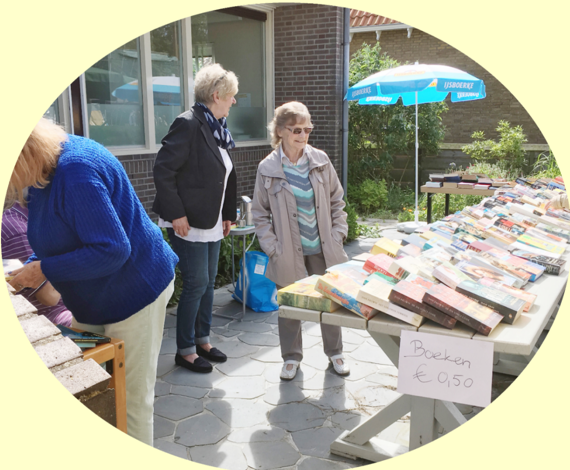
Afb. 2. Tijdens de Pinkstermarkt op 9 juni en tijdens " Petten ruimt op" op 21 juli 2019 gingen overvloedige boeken á € 0,50 per stuk gretig over de toonbank

Met deze opbrengst is op zondag 4 augustus een brunch voor alle vrijwilligers en de vaste gasten van het DOP georganiseerd. Vanwege de grote toeloop zijn we naar de kantine van het MFR-gebouw uitgeweken. De ingrediënten daarvoor zijn door onze vrijwilligers voorbereid. Zie hiervoor op onze website www.doppetten.nl bij het hoofdstuk "Fotoalbum" het "Fotoboek brunch DOP 2019".