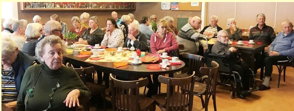
Afb. 11. Volle zaal bij het bezoek van Sinterklaas 5 december 2019

Door een grotere toeloop en omdat we onze activiteiten willen uitbreiden is een onderzoek opgestart naar mogelijke uitbreiding van het DOP-gebouw. Zie hoofdstuk 8.