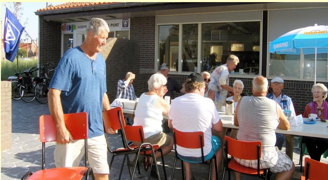
Afb.: 5. Tijdens openingsuren in het seizoen wordt de VVV-vlag uitgehangen

We hebben intussen meerdere adressen van locaties waar gasten ontvangen kunnen worden. Ook daarvan wordt zo nodig gebruik gemaakt.