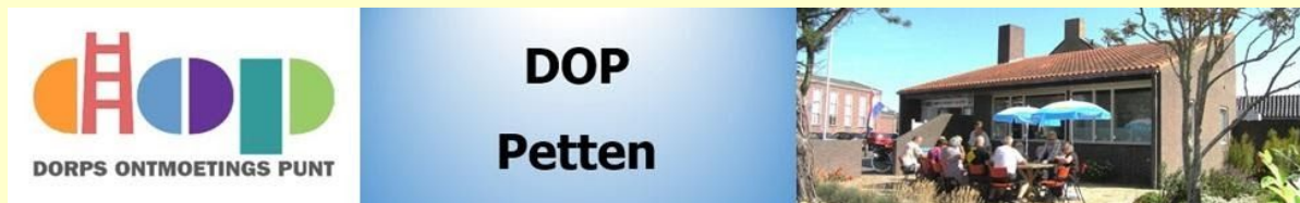
Afb. 6. Bovenbalk website www.doppetten.nl

Vanaf augustus 2015 is onze website www.doppetten.nl actief.