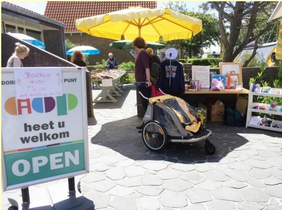
Afb. 3. De verkoop van boeken vereiste een ruime opstelling zowel binnen als buiten het DOP-gebouw