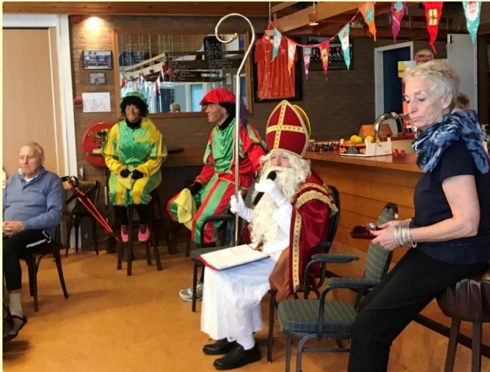
Afb. 10. Sinterklaas bezoekt de DOP-bijeenkomst 5 december 2019

Het is intussen traditie dat Sinterklaas na zijn bezoek aan de lagere school ook het DOP bezoekt. Ook ditmaal hebben we daartoe de sportkantine in het MRF-gebouw heringericht en dit een zo gezellig mogelijke opzet gegeven. De Sint werd dit jaar door twee roetveegpieten vergezeld. Hij bleek goed op de hoogte van de plaatselijke situatie en haalde meerdere vrijwilligers naar voren die zich voor het DOP en ook voor ander activiteiten zich als vrijwilliger inzetten, zoals voor de Zonnebloem. De bijeenkomst werd met een broodmaaltijd afgesloten.