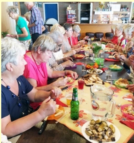
Afb. 9. De brunch-maaltijd op 4 augustus in de MFR werden door velen bezocht en viel goed in de smaak